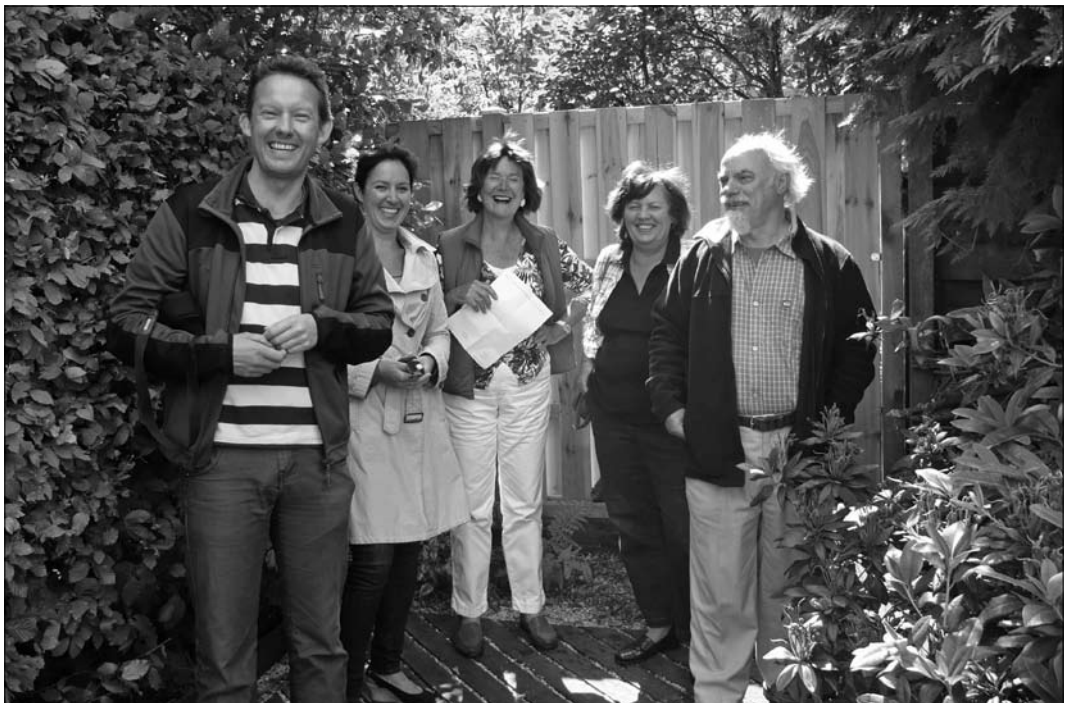
Een zonnige groep bewonderaars van zonnepanelen die zich op 23 juni in een huis aan de Pauwenlaan uitgebreid liet informeren

In totaal zo'n 25 wijkbewoners bezochten rond het middaguur één of meer adressen om meer te weten te komen over allerlei milieuvrien-